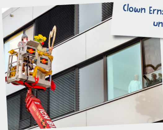
Für Krishma wagen sich die Clowns hoch hinaus.